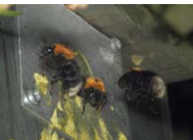
Nyth B. hypnorum mewn blwch aderyn

Hymettus Cyf yw'r brif ffynhonell am gyngor ar gadwraeth gwenyn, gwenyn meirch a morgrug ym Mhrydain ac Iwerddon.