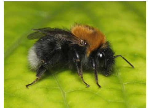
Brenhines Bombus hypnorum yn gorffwys ar ddeilen