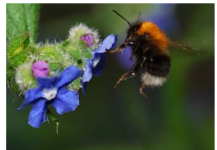
Ymweld â blodau Llysiau'r gwrid. Yn dangos y patrwm lliw unigryw